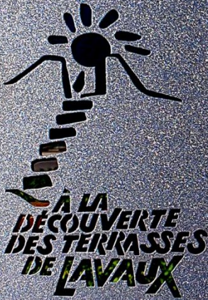
Clos des Moines